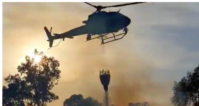
16. Mai 2020 (YouTube)

Im größten Teil des Landes wurden Temperaturen über 104°F (40°C) gemeldet. Mekorot, das Wasserunternehmen von Israel, berichtete, dass der Wasserverbrauch des Landes aufgrund der Hitzewelle am Montag, Dienstag und Mittwoch sowohl in der Landwirtschaft als auch beim Trinkwasser um 32% gestiegen sei.