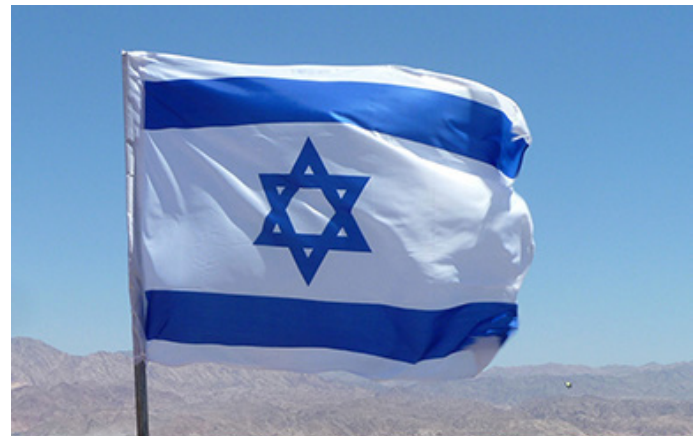
Eilat am Roten Meer

„Danke Gott für Israel. Danke, Gott, jeden Tag, für das Wunder Israels, nach dem sich Israels Vorfahren geseht und für das sie gebetet haben. Danke für die wunderbare Errettung und den Beginn der großen Erlösung Israels und der Welt. Gott, beschütze die Verteidiger unseres Heiligen Landes, die mit Gewehren und Gebetsbüchern bewaffnet sind. Schütze Israel vor dem grundlosen Hass unserer Feinde und vor uns selbst. Gott, erhebe Israel als ein Licht für die Nationen, das der Welt Frieden und Erlösung bringt. Gott, wir wissen wir verdienen es nicht, und dennoch sind wir ungeduldig. Die Geburtswehen der Erlösung sind schmerzhaft, und wir beten für ein Ende dieser 2.000 Jahre des Wartens. Möge unser müder Geist aufleben. Erfülle heute Dein Versprechen. Sammle den Rest Deiner zerstreuten Kinder Israels, die in alle vier Himmelsrichtungen der Erde verstreut sind. Versammle diejenigen, die geistlich