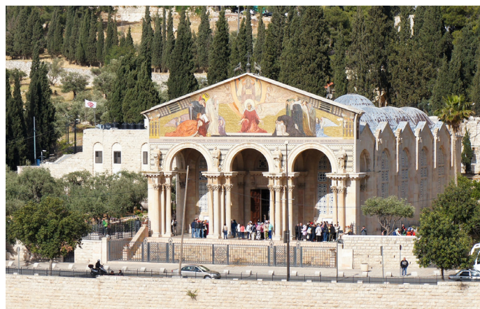
Kirche aller Nationen, Jerusalem

Gottes Wort bestätigt dies. Jeremia sagt uns: „Dies ist das Wort, das vom HERRN an Jeremia erging“ (Jeremia 7,1): „Ist denn dieses Haus, das nach meinem Namen genannt ist, in